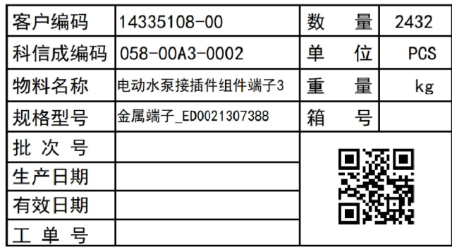
厂内外箱标签 图九